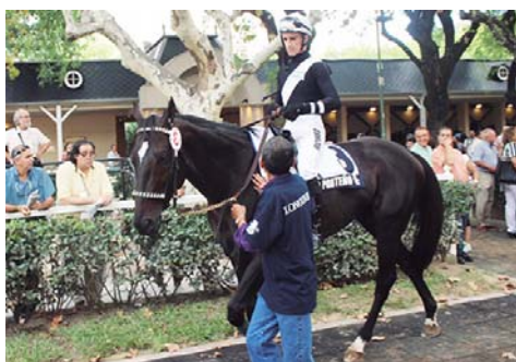
En el hipódromo San Isidro