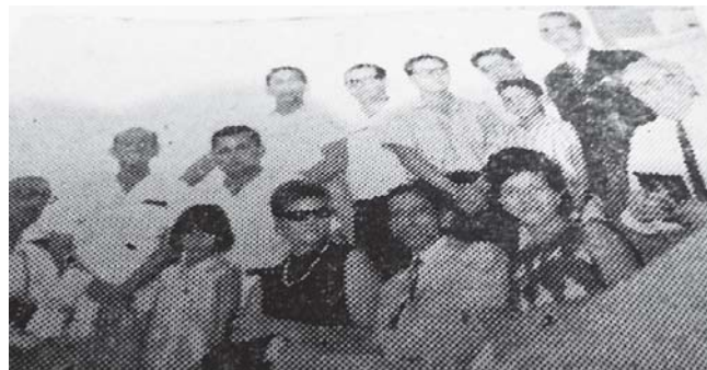
Con los periodistas de la ACHE que le otorgaron Medalla de Honor